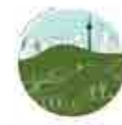
PUENTE DE VALLECAS