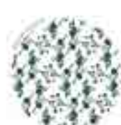
SAN BLAS - CANILLEJAS