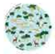
FUENCARRAL - EL PARDO