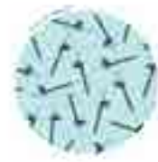
MONCLOA - ARAVACA