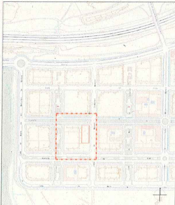
SITUACION ESCALA 1:4.000