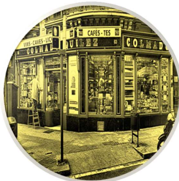
LA TIENDA DE ULTRAMARINOS DEL BARRIO