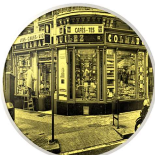
LA TIENDA DE ULTRAMARINOS DEL BARRIO