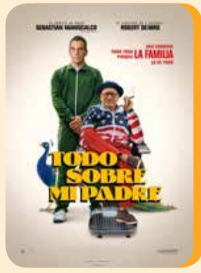
Miércoles 3 TODO SOBRE MI PADRE