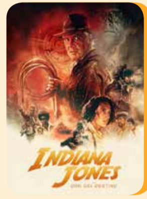
Miércoles 10 INDIANA JONES Y EL DIAL DEL DESTINO