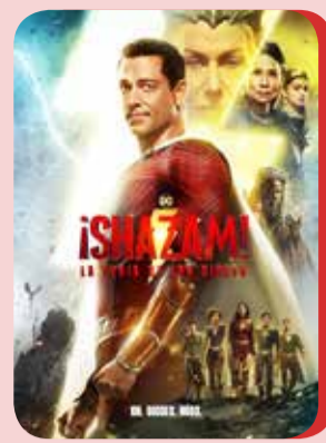
Jueves 20 ¡SHAZAM! LA FURIA DE LOS DIOSES