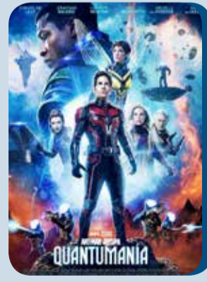
Jueves, 22 ANT-MAN AVISPA QUANTUMANÍA