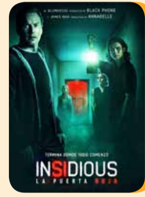
Miércoles, 24 INSIDIOS LA PUERTA ROJA