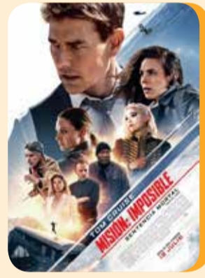
Miércoles, 17 MISIÓN IMPOSIBLE SENTENCIA MORTAL