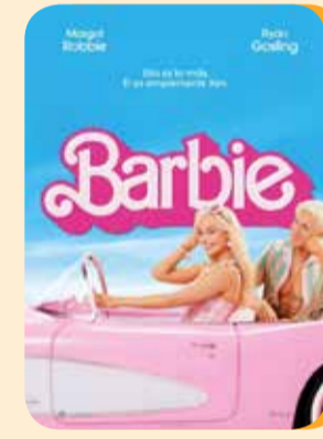
Jueves, 25 BARBIE