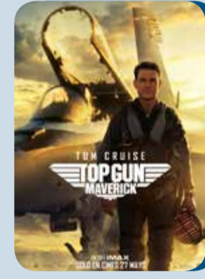
Miércoles, 14 TOP GUN MAVERICK