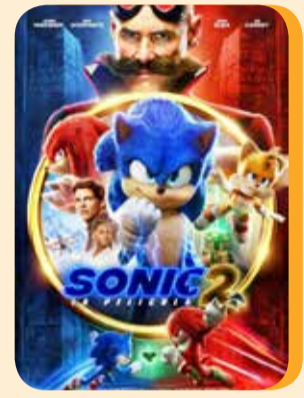
Jueves 11 SONIC 2 LA PELÍCULA