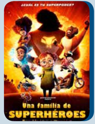
Jueves, 29 UNA FAMILIA DE SUPERHÉROES