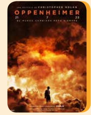
Miércoles, 31 OPPENHEIMER