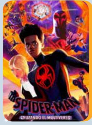
Jueves, 1 SPIDER-MAN CRUZANDO EL MULTIVERSO