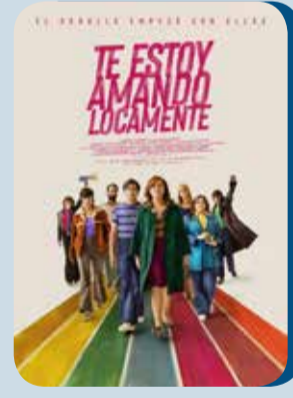
Miércoles, 7 TE ESTOY AMANDO LOCAMENTE