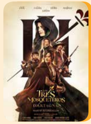
Jueves 4 LOS TRES MOSQUETEROS D'ARTAGNAN