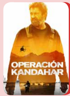
Miércoles 26 OPERACIÓN KANDAHAR