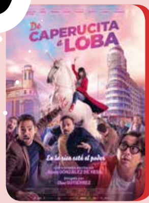
Miércoles 19 DE CAPUCITA A LOBA