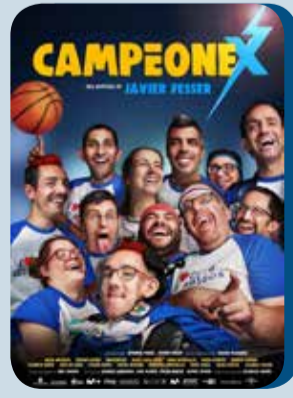
Miércoles, 21 CAMPEONEX