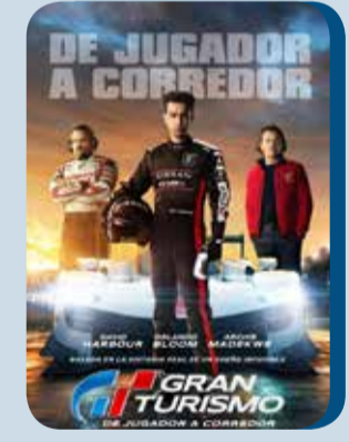
Jueves, 15 GRAN TURISMO