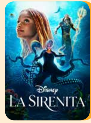
Jueves, 18 LA SIRENITA