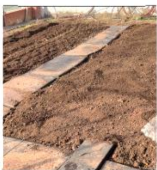
MANTENEMOS LAS COMPOSTERAS.