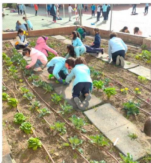
ASÍ NOS ORGANIZAMOS