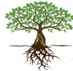
ÁRBOL DE OBJETIVOS