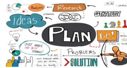
PROPUESTAS DE ACCIÓN

Coordinadores/as, docentes y personas que cuentan con experiencia en el huerto escolar (3 h)