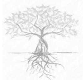
ÁRBOL DE PROBLEMAS