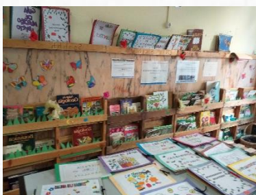
Rincón CC Luis Feito