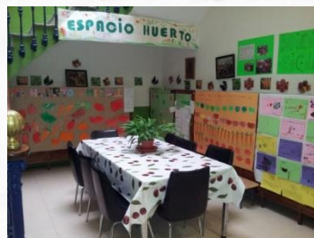
Rincón CEIP Fernando el Católico