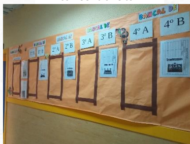
Rincón CEIP Parque Aluche