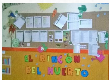
Rincón primaria e infantil CC Gaudem