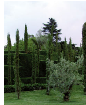
Bosque del Recuerdo

El siguiente tramo incluye dos de las actuaciones más recientes, el jardín conmemorativo del Bosque del Recuerdo (levantado en 2005) y los más de trescientos almendros que componen el Huerto del Francés, composición arbórea que prevaleció desde su fundación hasta su conversión en parque público, pues los jardines del Buen Retiro siempre incluyeron árboles ornamentales y frutales.