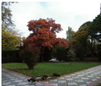
Jardines de Cecilio Rodríguez

En este tramo de la ruta destacan, por su exotismo, el abeto de Masjoan y el arce plateado, además del empleo del ciprés de Monterrey formando macizos con los que se refuerza el carácter arquitectónico del jardín clásico.