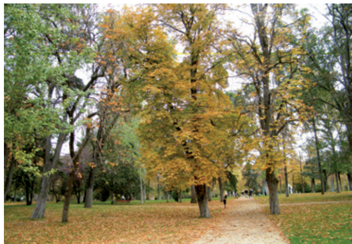
El Campo Grande