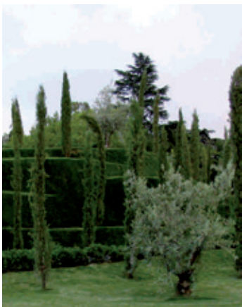
Bosque del Recuerdo

Del siguiente tramo, que se inicia en el jardín conmemorativo del Bosque del Recuerdo, conviene destacar el plantío de más de trescientos almendros que componen el Huerto del Francés, ya que nos remite a la composición arbórea del Retiro que prevaleció entre su fundación y su conversión en parque público en 1868. Hasta entonces, los jardines del Buen Retiro siempre incluyeron árboles ornamentales y frutales.