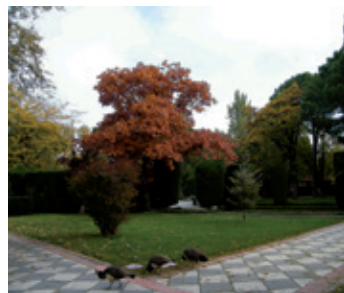
Jardines de Cecilio Rodríguez

En este tramo de la ruta destacan, por su exotismo, el abeto de Masjoan y el arce plateado, además del empleo del ciprés de Monterrey formando macizos con los que se refuerza el carácter arquitectónico del jardín clásico.