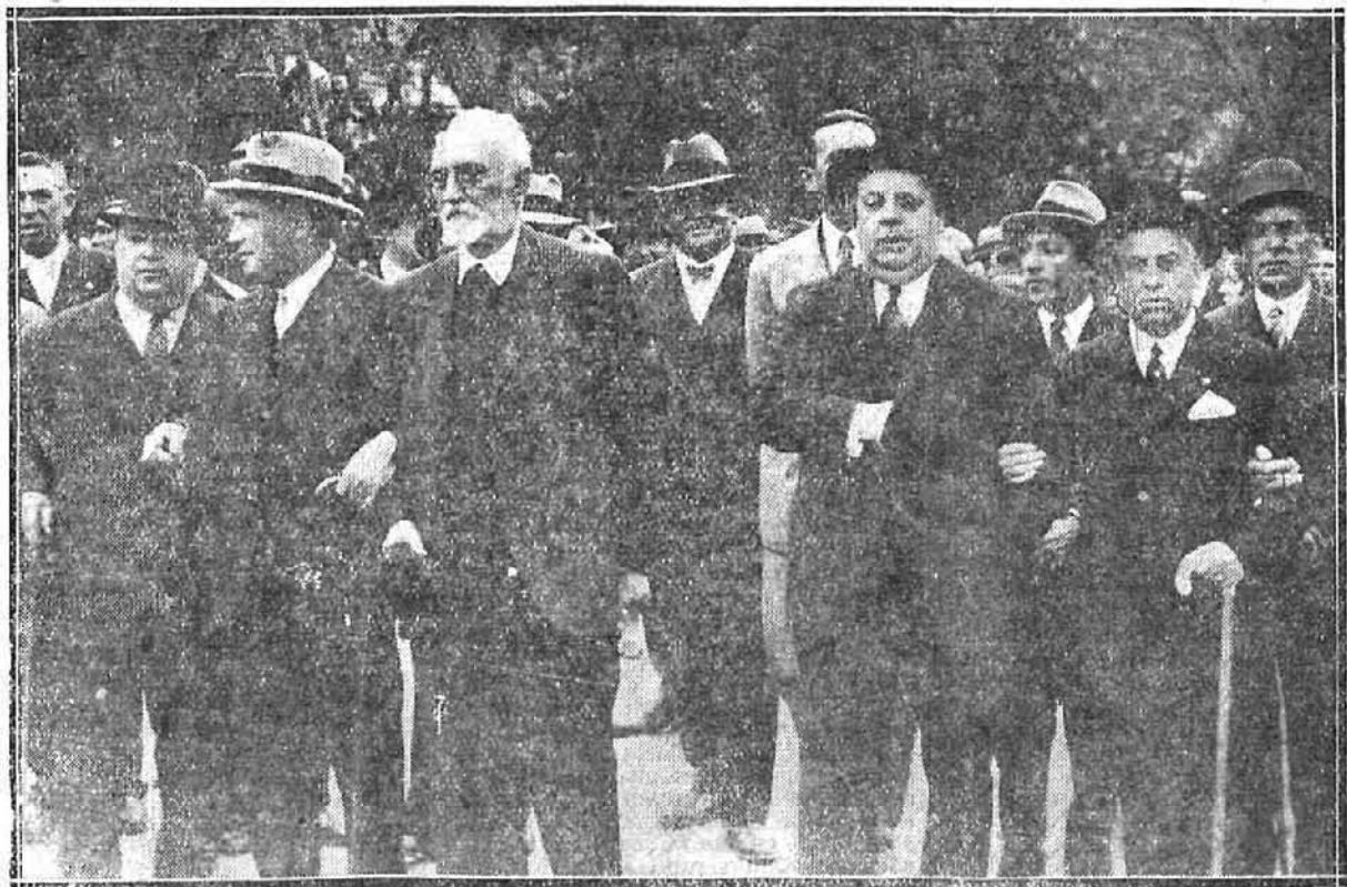
Los señores Unamuno, Indalecio Prieto, Largo Caballero y Rico en la presidencia de la manifestación.

(Continúa la información en la página tercera.)