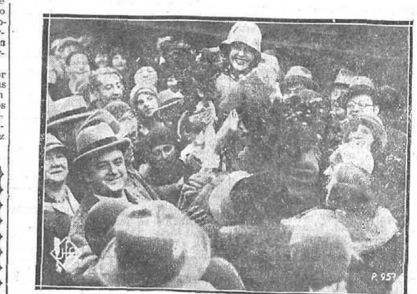
Recibimiento hecho en Viena a Lillian Harvey, protagonista de la película «Vals de amor», al llegar para presenciar el estreno en dicha capital.

Martes noche, en SESION DE GALA, ESTRENO en RIALTO de MONTECARLO Por la feliz intérprete de EL DESFILE DEL AMOR Jeannette Mac Donald Una nueva opereta de fina gracia y humorismo, dirigida por el genial animador ERNST LUBISTSCH Es un film PARAMOUNT... que usted verá con de cete