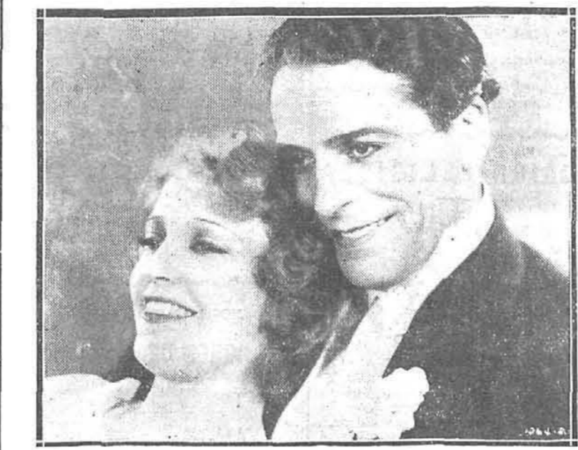
Jeannette Mac Donald en «Montecarlo», película Paramount, que se estrena el día 5 en Rialto.

Es imposible darse idea de lo que es esta cinta sin verla. Cuanto pudiéramos decir resultaría pálido ante la realidad y no podría dar nunca idea de lo que es.