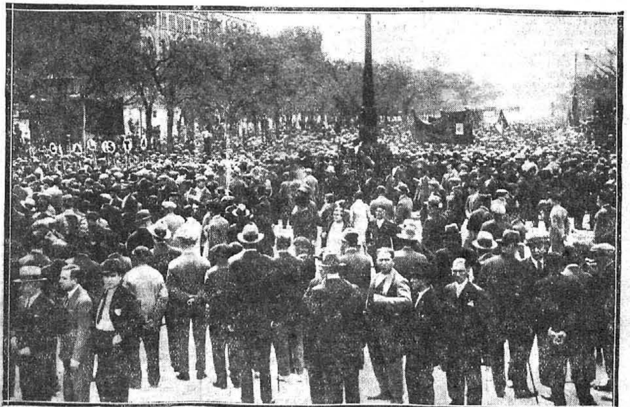
La manifestación socialista en el paseo del Prado.