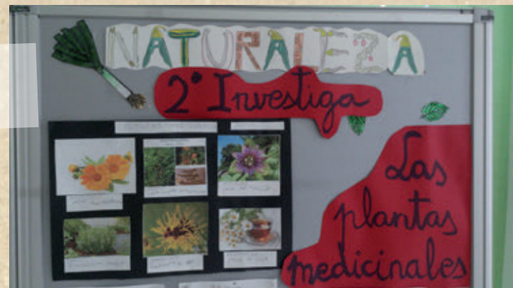
Trabajos de investigación