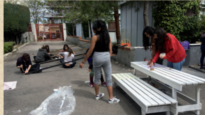
Construcción de mobiliario para la mejora de patios escolares