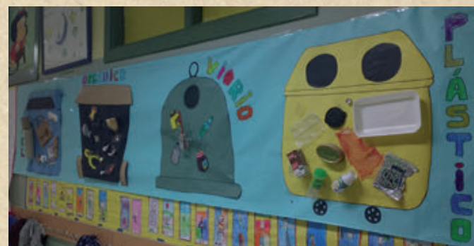
Separación de residuos.