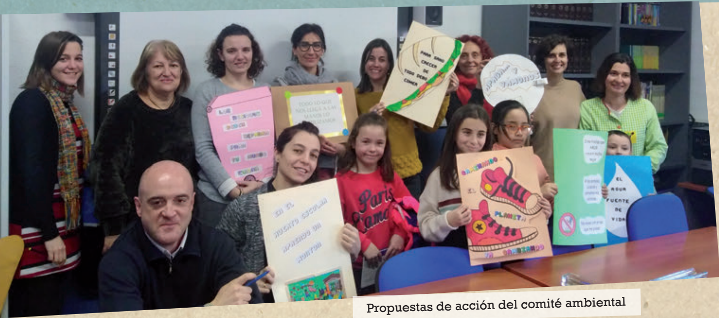
Propuestas de acción del comité ambiental