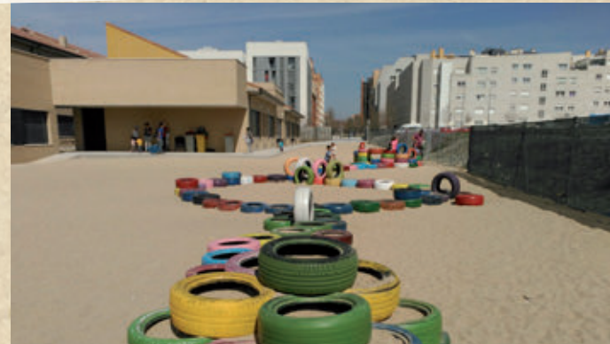
Espacio diseñado por el alumnado con el apoyo de técnicos especializados: arquitectos, diseñadores...